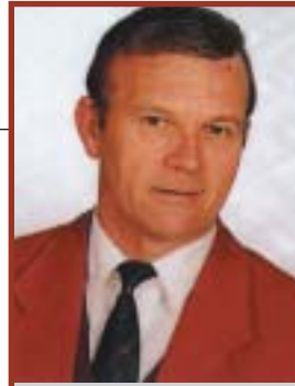
Wirken auf internationalem Parkett

bei den NBC-Mannschaftswettbewerben erlebt hat, kann mit Sicherheit bestätigen: Die Spiele waren in jeder Phase spannend und in Osijek, wo die Entscheidung der Damen sogar im »Sudden Victory« fallen musste, war die Spannung nahezu unerträglich. Die Ninepin Bowling Classic ist für die Entwicklung ihres sportlichen Bereiches selbst verantwortlich. Die Mitglieder wurden in jeder Phase eingebunden und hatten die Möglichkeit, Anträge und Konzepte zu überprüfen, eigene Vorschläge zu machen und auch Änderungen anzuregen. Das demokratische mehrheitliche Votum der Mitgliedsverbände hat das Präsidium zu respektieren und die Beschlüsse umzusetzen.