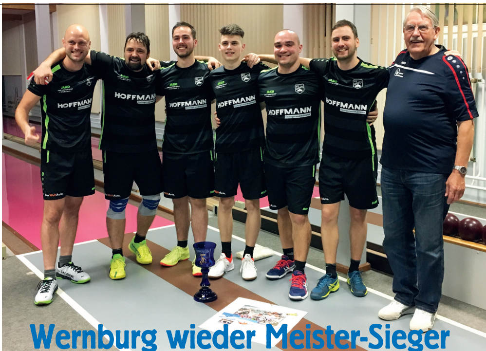
Wernburg wieder Meister-Sieger

Hinweis Punktwertung: In jedem Satz werden 6 – 5 – 4 – 3 – 2 – 1 Punkte vergeben; ein Starter kann danach in vier Sätzen max. 24 Satzpunkte, das Team max. 144 SaP erreichen.