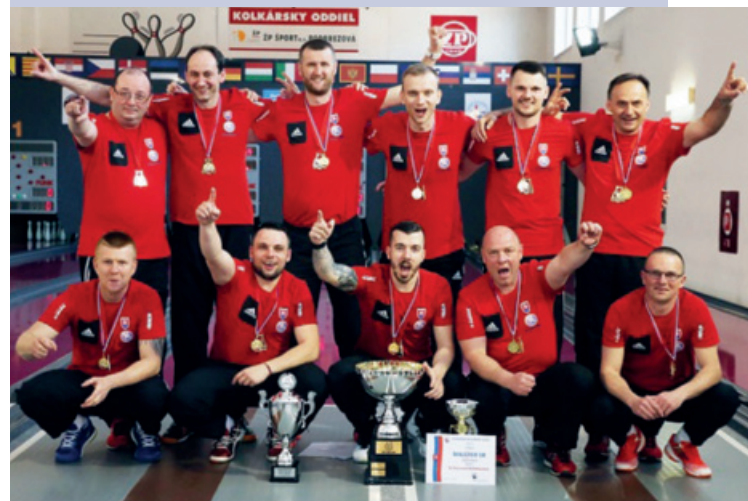
Das Meistererteam der SVK / CZE-Interliga und CHL-Sieger 2018 SK Zeleziarne Podbrezova (SVK), wie man sich auf der eigenen Internetseite stolz präsentiert.